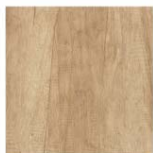
ROBLE NEBRASKA K