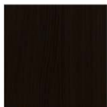
ROBLE OSCURO R