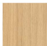
ROBLE NATURAL T